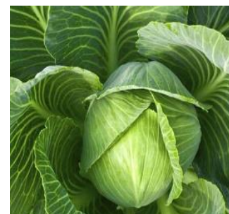
Зураг 3: Хургалаг сортын байцаа