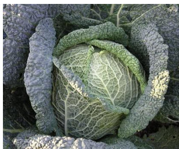
Зураг 2: Ногоон бүрзгар байцаа