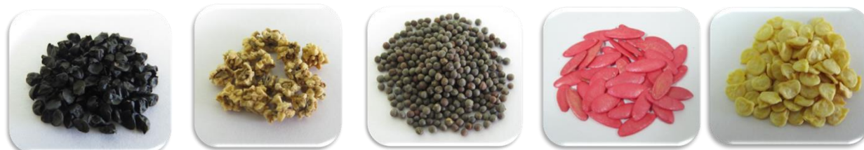
Зураг 7: Сонгино, хүрэн манжин, байцаа, хэмх, амтат чинжүүний үр