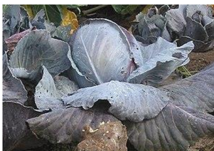
Зураг 1: Улаан өнгөнтэй байцаа

Манай оронд бөөрөнхий цагаан байцааны эрт болцтой Номер первый 147, Июньская 3200, дунд орой болцтой Белорусская 85, Белорусская 455, Ширхэнцэг 13, Хургалаг зэрэг сортуудыг нутагшуулан үрийг нь дотооддоо үржүүлж байна.