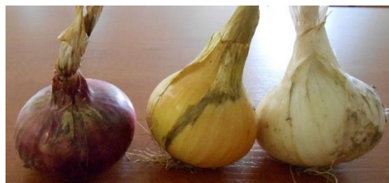
Зураг 6: Бөөрөнхий сонгины өнгөний ялгаа

Сонгинолог тарималд батун, тагар, сармис болон бөөрөнхий сонгино хамрагддаг. Бөөрөнхий сонгино Дундат Азиас гаралтай улаан, цагаан, шаргал хальстай, бөөрөнхий, хавтгай бөөрөнхий зүйвэн дугуй хэлбэрийнх зонхилно. Манайд бөөрөнхий хэлбэрийн Стригуновский, хавтгай хэлбэрийн Бессоновский, Штуттгартер ризен зэрэг сортууд нутагшиж өргөнөөр тариалагдаж байна.