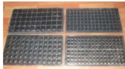
Зураг 1: Хоовон