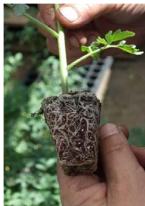
Зураг 4: Лоолийн үрслэг