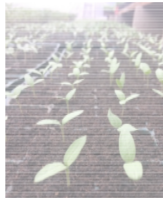
Зураг 5: Хэмхний үрслэг