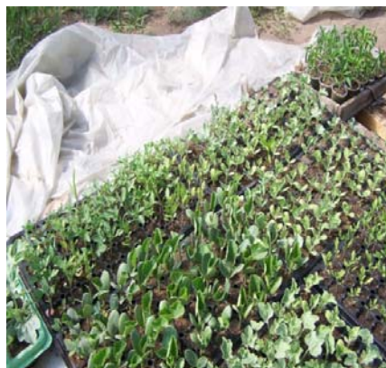
Зураг 3: Бусад таримлын үрслэг