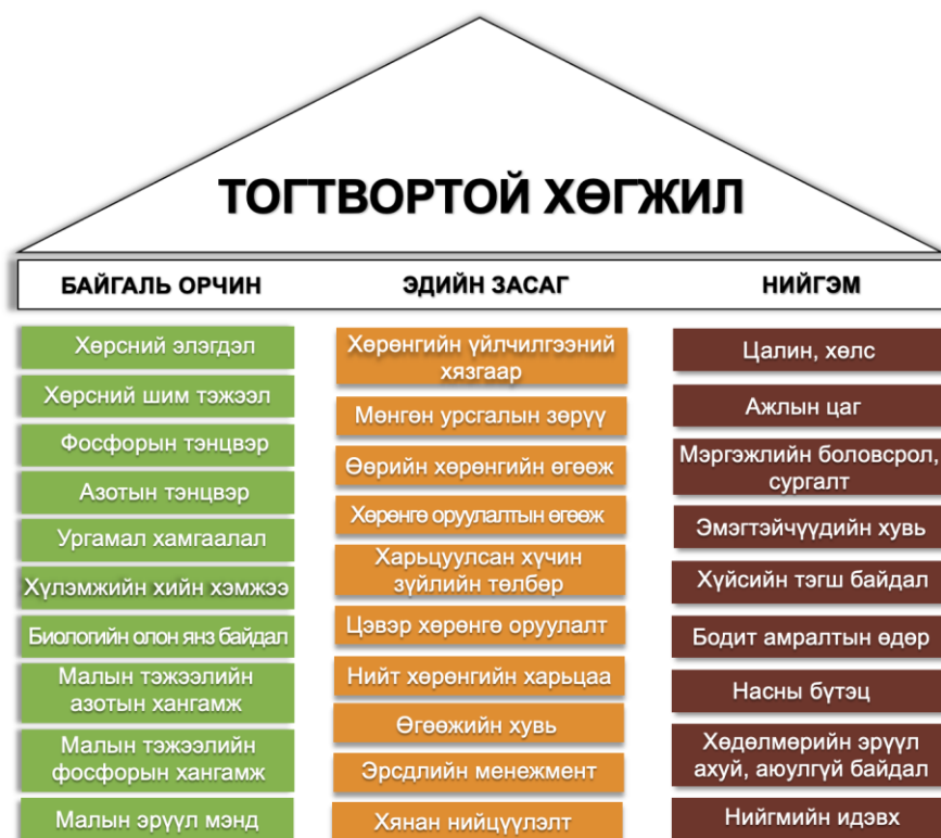
Зураг 2: Тогтвортой хөгжлийн шалгуур үзүүлэлт

Хөдөө аж ахуйн анхан шатны үйлдвэрлэлийн тогтвортой байдлын зэрэглэлийг тогтоох нь нэг талаасаа хөдөө аж ахуйн үйлдвэрлэл эрхлэгчдэд, нөгөө талаасаа бүс нутгийн түвшинд тогтвортой хөгжлийн бодлогыг хэрэгжүүлэх боломжийг олгоно. Байгаль орчинд ээлтэй, эдийн засгийн үр ашигтай, нийгмийн хариуцлагатай байх гэсэн энэхүү тулгуур гурван үзүүлэлтийг үнэлснээр бизнесийн байгууллагууд үйл ажиллагаагаа илүү тогтвортойгоор эрхлэн явуулах үндэслэл бүрдэнэ.