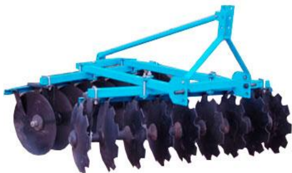
Зураг 2: Сэндчилүүр