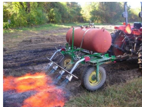
Зураг 6: Хог ургамлыг галаар устгаж байна (эх сурвалж:

АНУ, Англи зэрэг зарим оронд хог ургамлыг галдан шатааж устгах аргыг хэрэглэдэг. Казахстан, Дундад Азийн улсуудад царгас, хөвөн, төмсний тариаланд ороонгыг шатаах аргыг өргөн хэрэглэдэг.