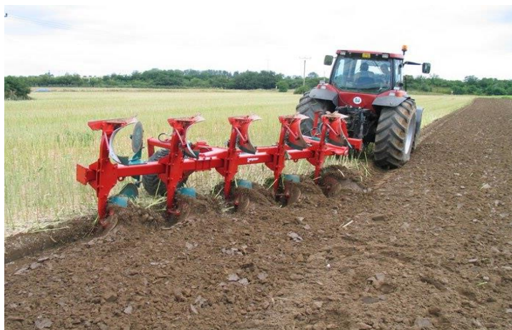
Зураг 4: Анжисаар гүн хагалж байна

Үндсээр үрждэг хог ургамалтай тэмцэх арга нь үндэслэг ишээр үрждэг ургамлынхтай адил зарчим дээр үндэслэгддэг. Энд мөн сульдаах, багтраах аргыг хэрэглэх бөгөөд устгах арга хэмжээг үндэсний системийн сульдсан үед тааруулан, үндэсний системд шим тэжээлийн бодис хуримтлагдах бололцоог хаахад чиглүүлэн явуулна. Үндсээр үрждэг хог ургамалтай тэмцэхэд гүн