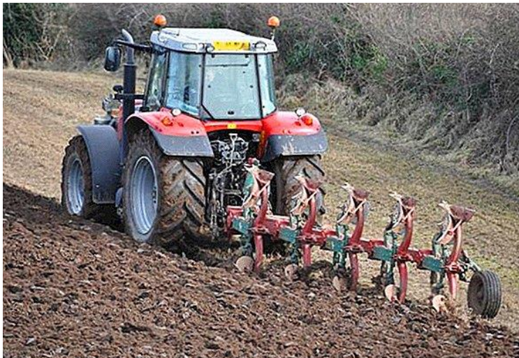
Зураг 1: Хөрс боловсруулалт

Талбайд хог ургамлын үрийг бөөнөөр нь соёлуулах буюу өдөөж ургуулан дараа нь соёолсныг устгах, ургаж байгаа ургамлын иш, навчийг үр боловсрохоос нь өмнө устгах аргыг хэрэглэдэг.