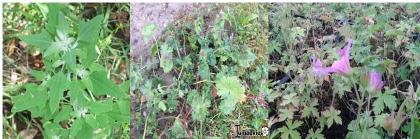
Зураг 5: Холимог хог ургамал ургасан талбай

Энэхүү талбайд хэдийгээр олон төрлийн хог ургамал ургасан байх боловч аль нэг бүлгийн ургамал голлосон байдаг. Иймд аль давамгайлж байгаа буюу устгахад бэрхтэй ургамлын эсрэг шаардлагатай арга хэмжээг авдаг.